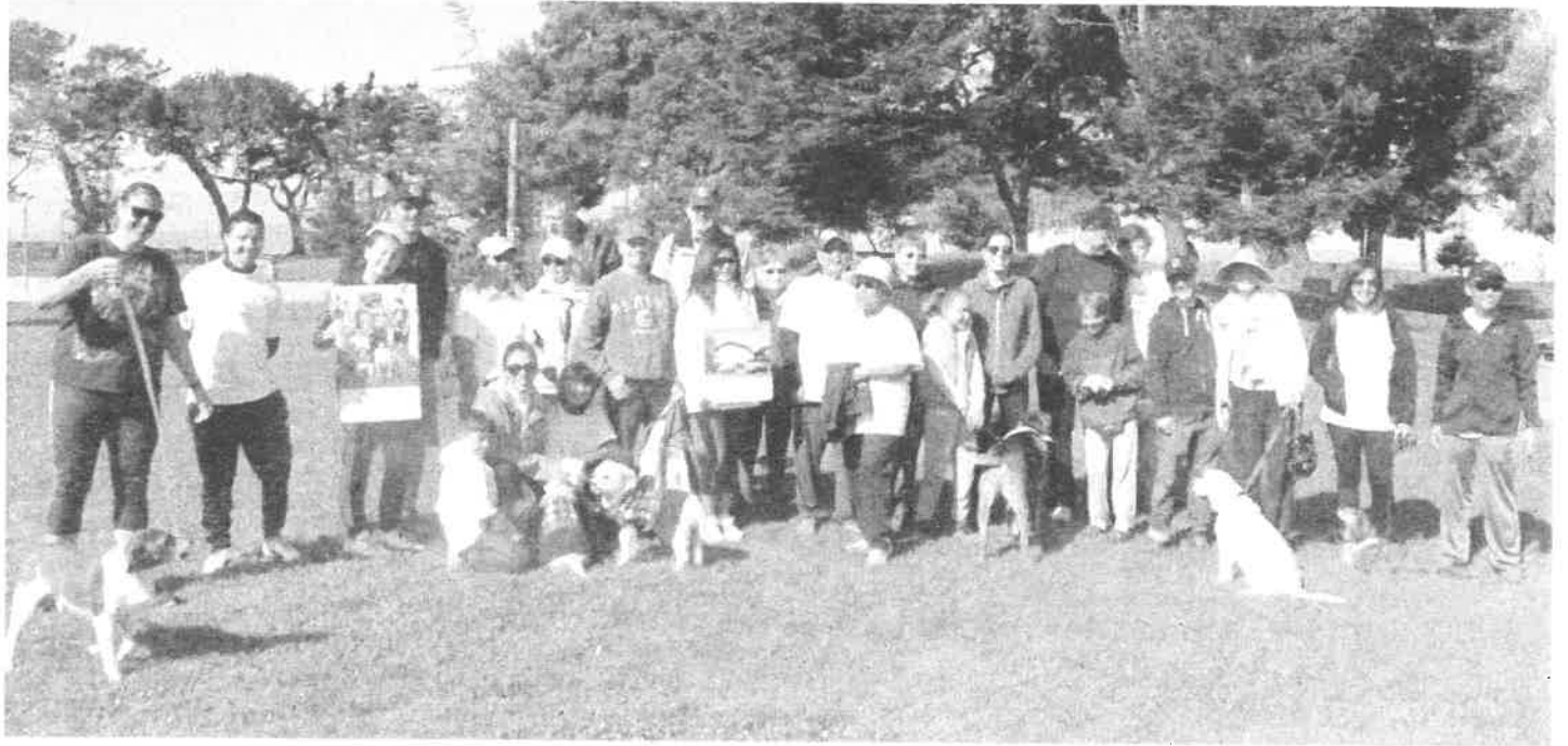
THE 2018 Our Lady of the Rosary FESCO Shelter Shuffle Team EL Equipo de Caminata 2018 Nuestra Señora del Rosario

Como siempre la Caminata de FESCO, que se llevo acabo el 28 de abril en la Marina de San Leandro, estuvo muy divertida. El clima nos favoreció después de unas gotas de lluvia en la mañana antes de que empezará la caminata. La foto de arriba no incluye todos los miembros ya que una familia de cinco miembros y otros participantes no llegaron hasta después de que se tomo la foto del equipo.