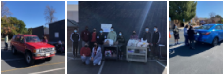
Bendiciones para todos ustedes.

Nuestra donación/drive-By el domingo pasado fue otro éxito rotundo, y el crédito por esto va principalmente a todos ustedes que participaron e hicieron generosas donaciones y contribuciones al esfuerzo. Crédito también a nuestro Grupo juvenil OLL y líderes adultos que coordinaron y personal del evento el domingo pasado.