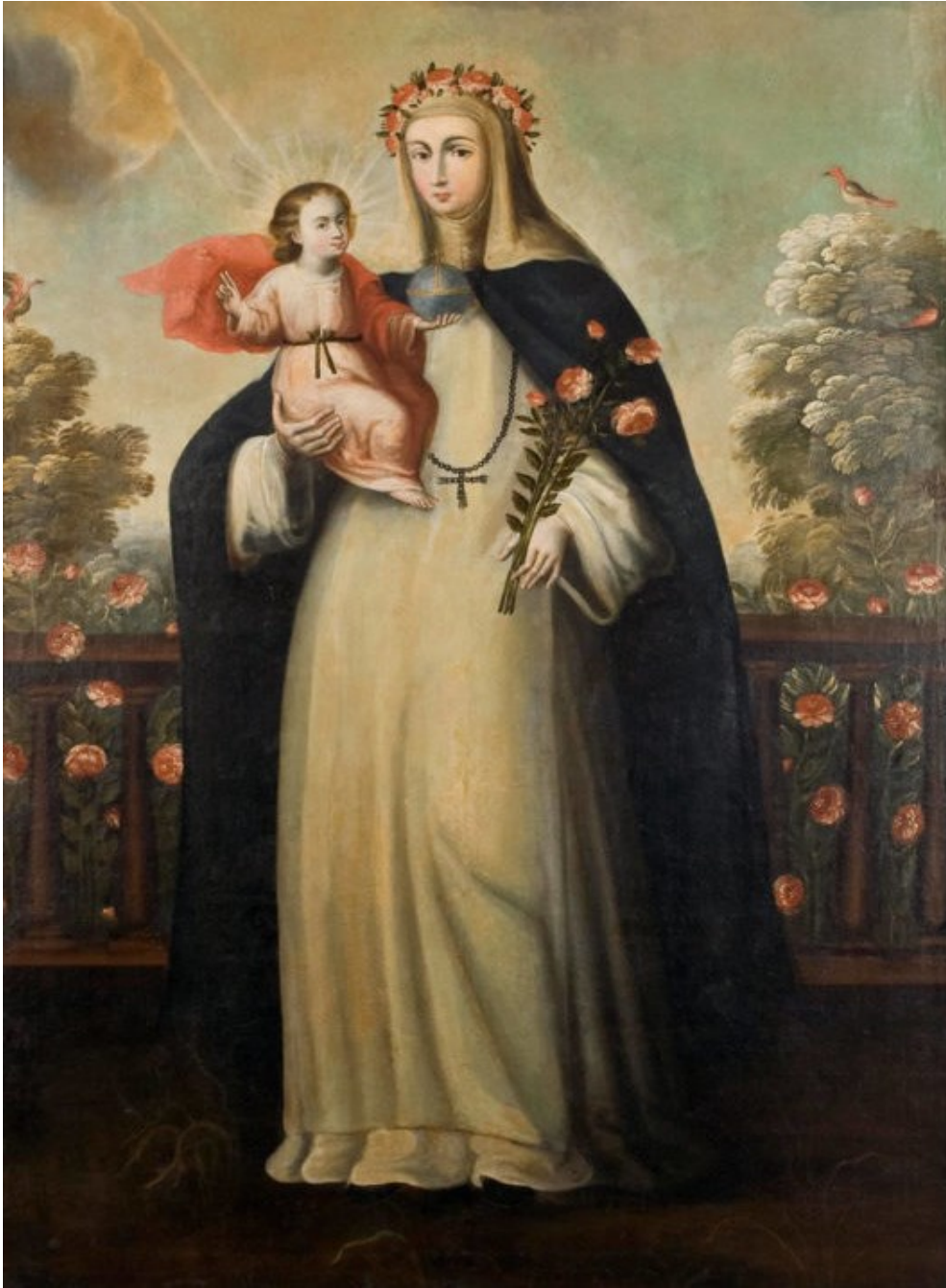
Santa Rosa de Lima con el Niño Jesús, artista desconocido, Escuela Cusco, 1680-1700