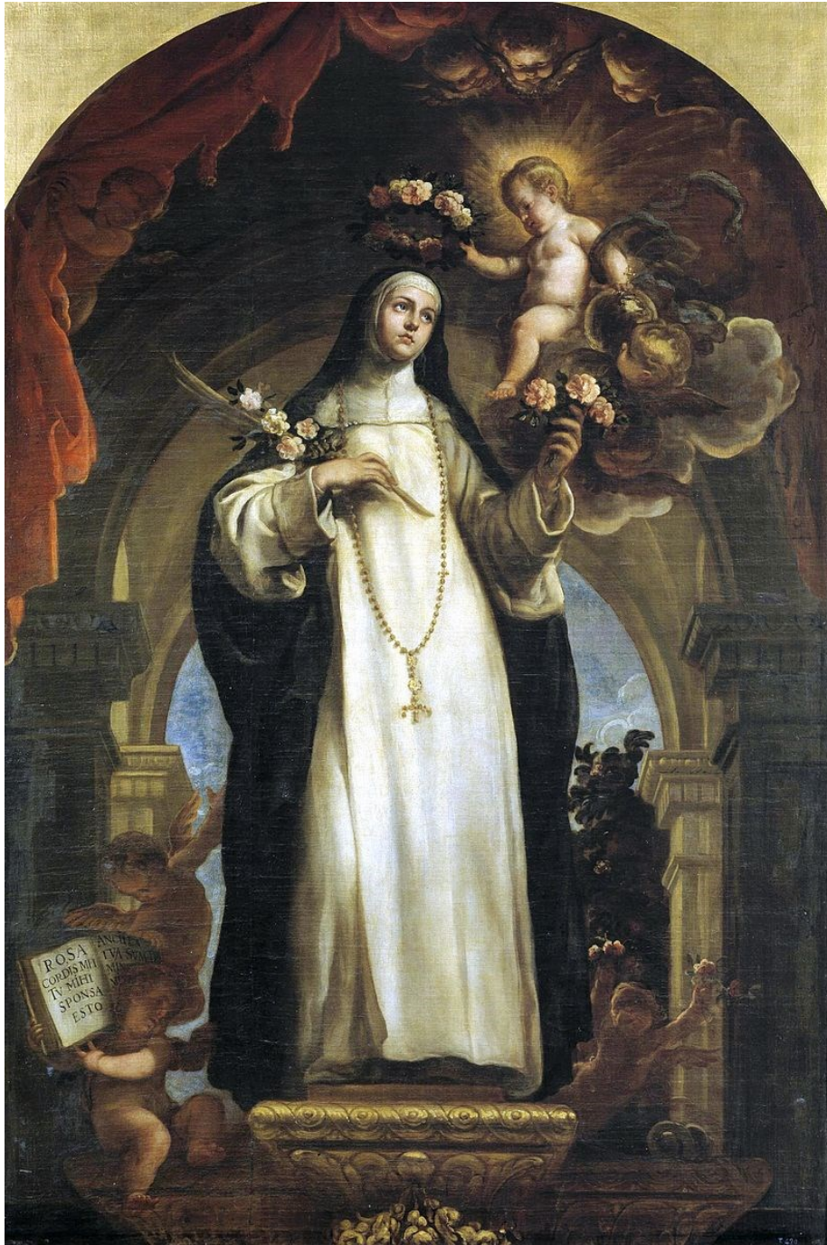
Santa Rosa de Lima de Claudio Coello, 1683