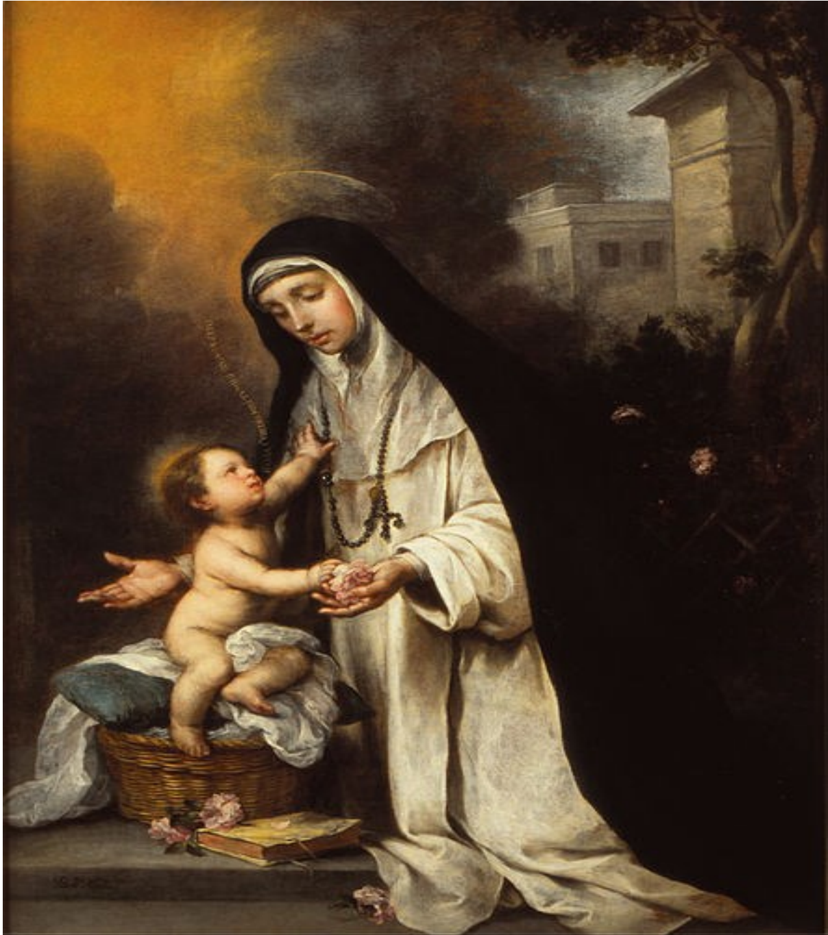
Santa Rosa de Lima de Bartolomé Esteban Murillo, 1670