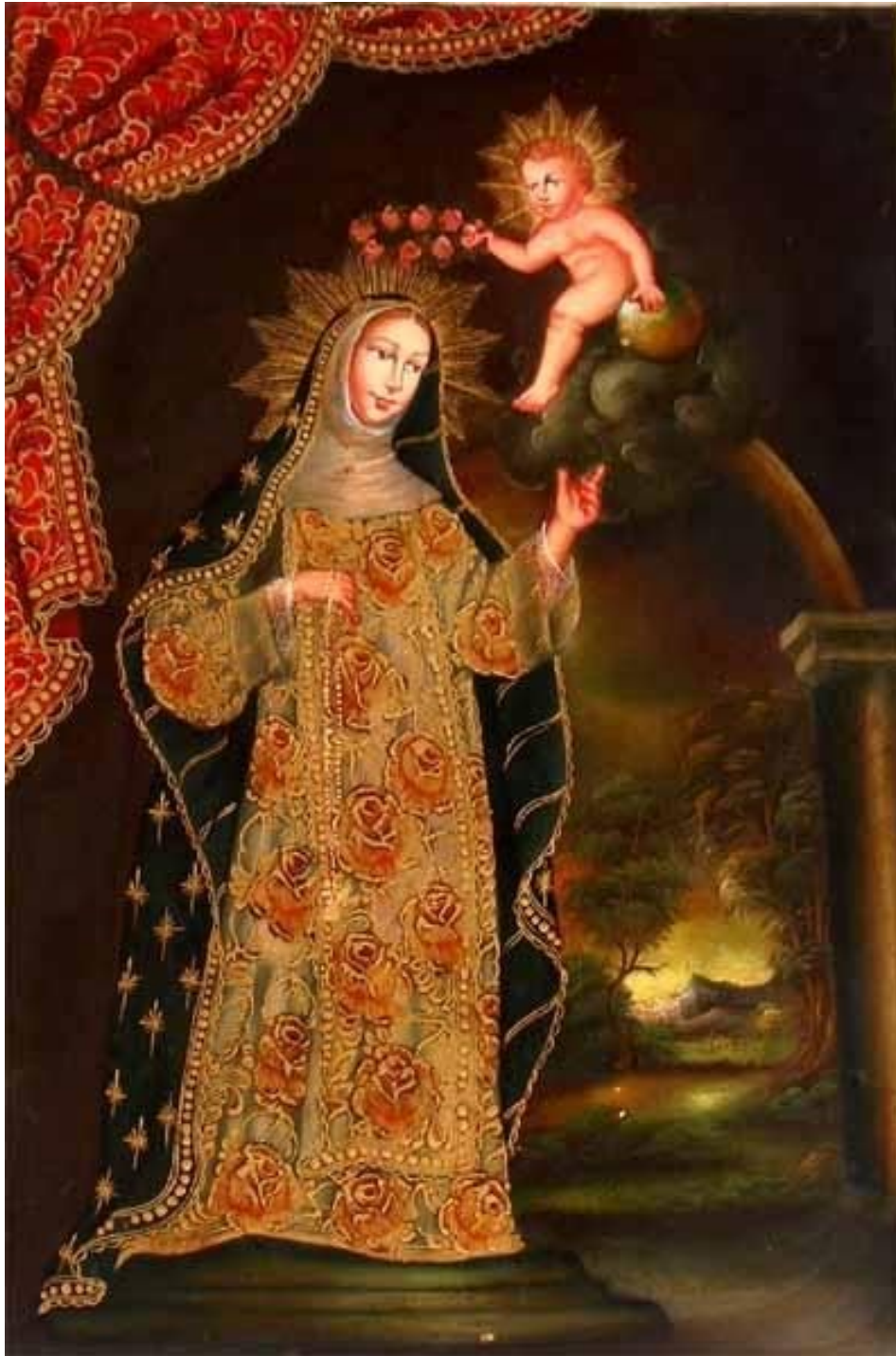
Coronación de Santa Rosa de Lima, Escuela Cusco, siglo XVII