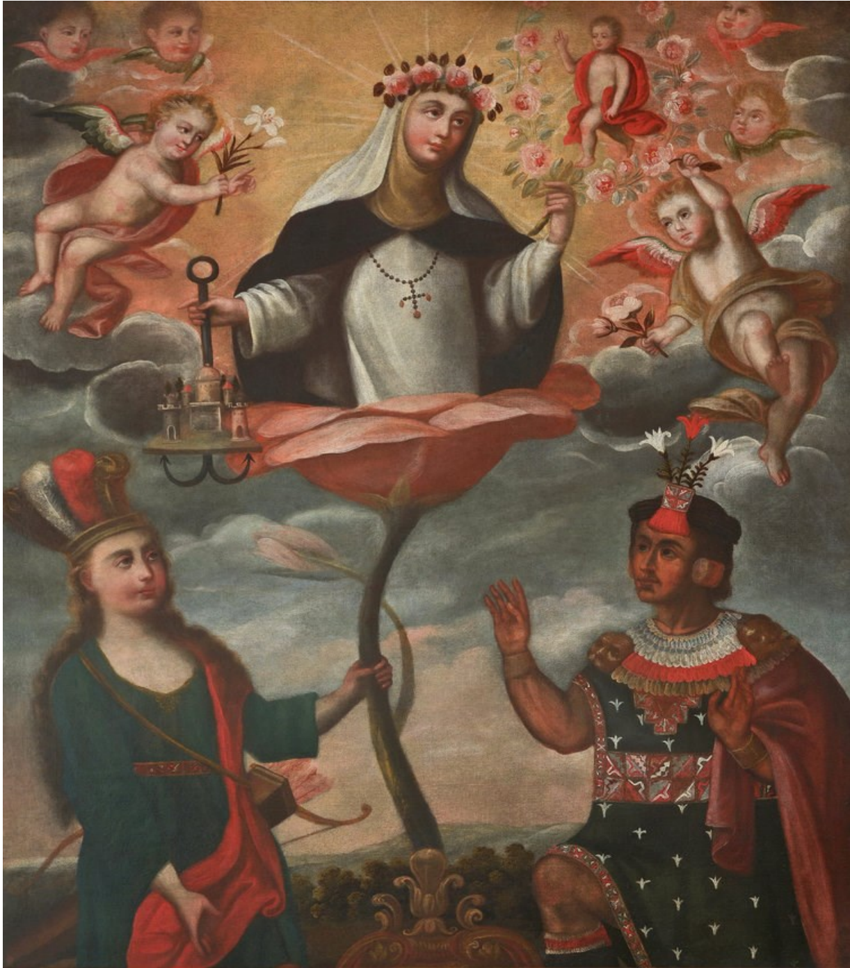
Alegoría de Santa Rosa de Lima, artista desconocido, 1700-1799