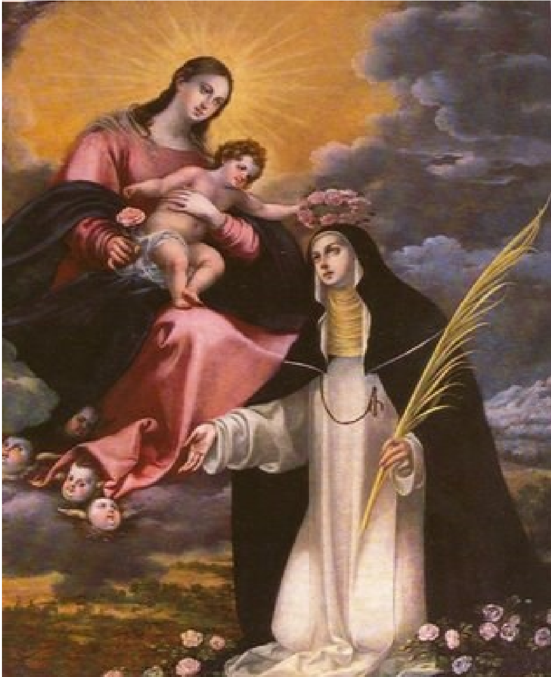
Santa Rosa de Lima, artista desconocido y año