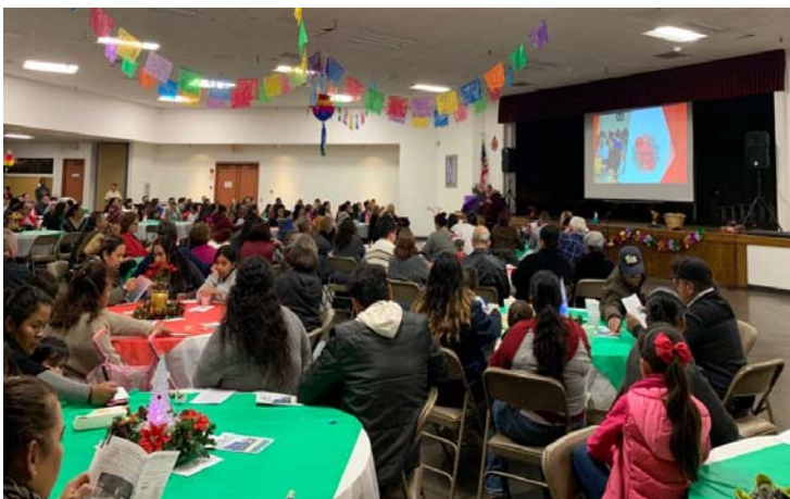
Picture of the Posada on December 17, 2018

The emphasis on both Peter and Paul aptly fits into the rationale of the octave. Peter is seen as the source of unity within the Christian tradition. Paul is highlighted due to his vision of bringing all to Christ. The Week of Prayer for Christian Unity is an ideal opportunity to pray for and promote respect, understanding, and, hopefully, eventual unity among Christians.